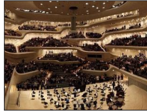
Elbphilharmonie und Laeiszhalle Hamburg www.elbphilharmonie.de