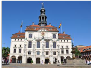
Stadtführung mit Lüneburger Highlights www.lueneburg.de