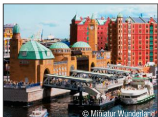
Miniatur Wunderland www.miniatur-wunderland.de