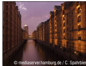
Weltkulturerbe Speicherstadt www.hamburg-tourism.de

Verbinden Sie Ihren Besuch bei eurolaser mit einigen schönen Tagen in Norddeutschland.