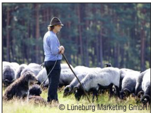
Lüneburger Heide www.lueneburger-heide.de