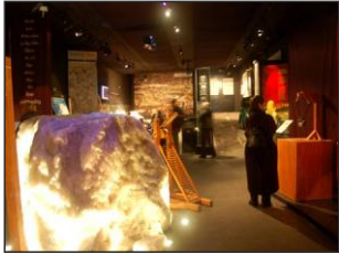
Deutsches Salz- museum Lüneburg www.salzmuseum.de