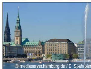
Alster mit Alsterseen in der Hamburger Innenstadt www.hamburg.de