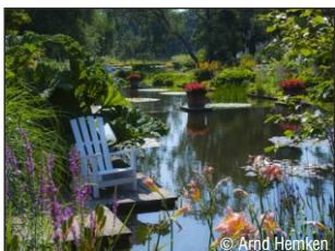
Planten un Blumen (Naturpark) www.plantenunblomen.hamburg.de