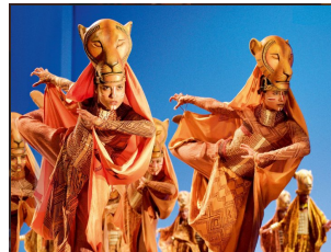
Musicals wie „König der Löwen“, „Wicked“, „Mamma Mia“ www.hamburg.de