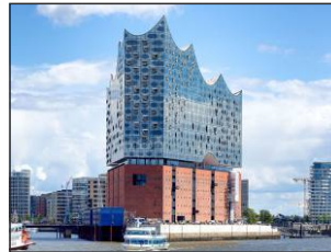
Plaza der Hamburger Elbphilharmonie www.elbphilharmonie.de