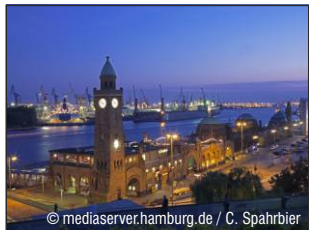
Hamburger Hafen www.hamburg-hafen.de