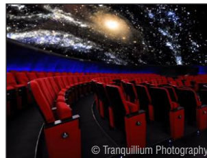
Planetarium im Stadtpark Hamburg www.planetarium-hamburg.de