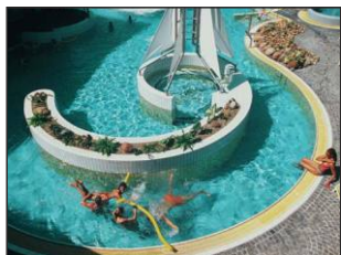
SaLü - Salztherme in Lüneburg www.kurzentrums.de